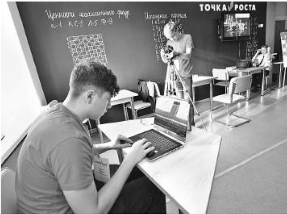
Школьная киностудия «Новое поколение»