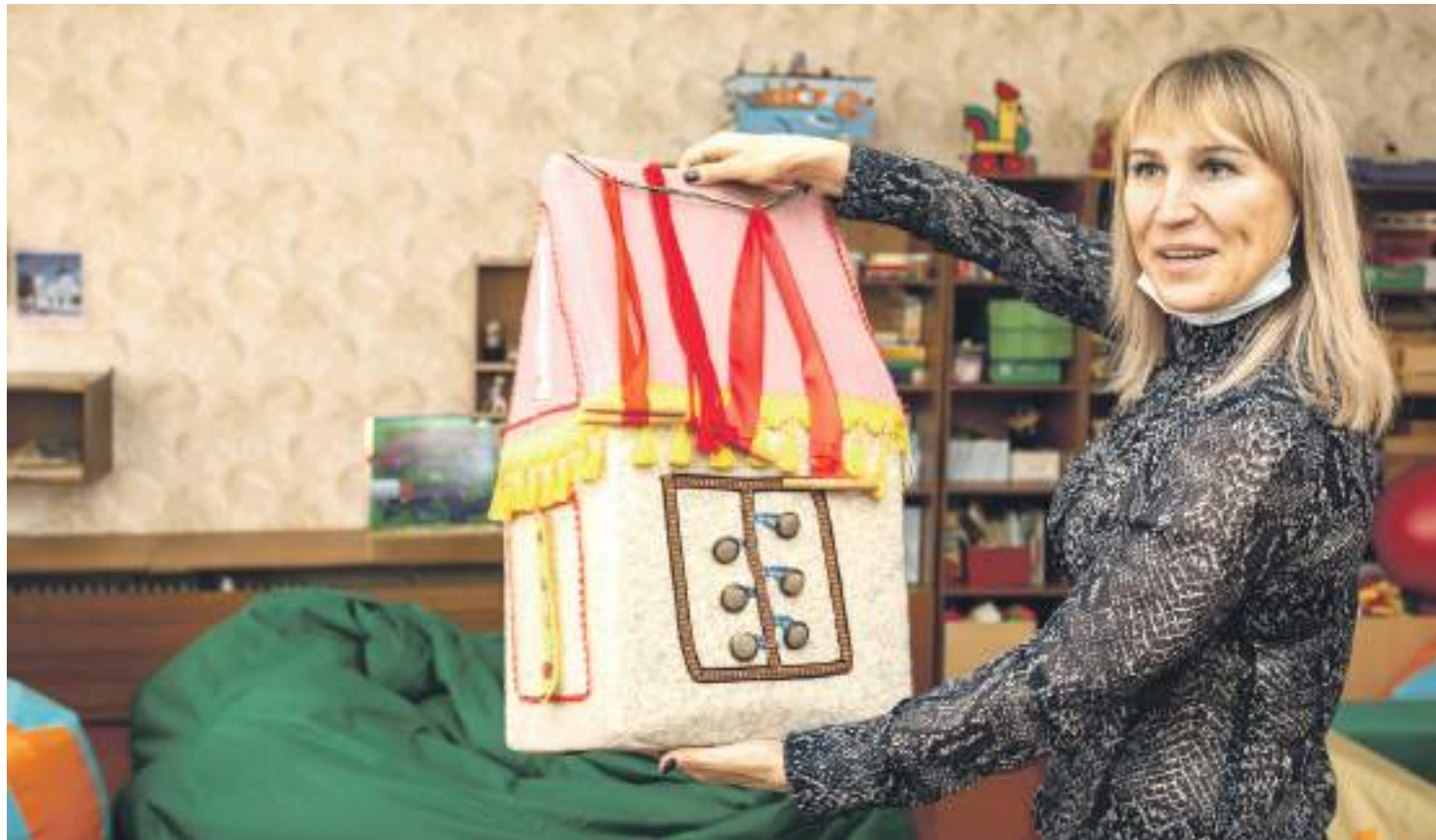
Оборудование для развития мелкой моторики

ПОЧЕМУ В НОВООСКОЛЬСКОЙ ШКОЛЕ-ИНТЕРНАТЕ РЕБЯТАМ ХОРОШО ТАК ЖЕ, КАК ДОМА