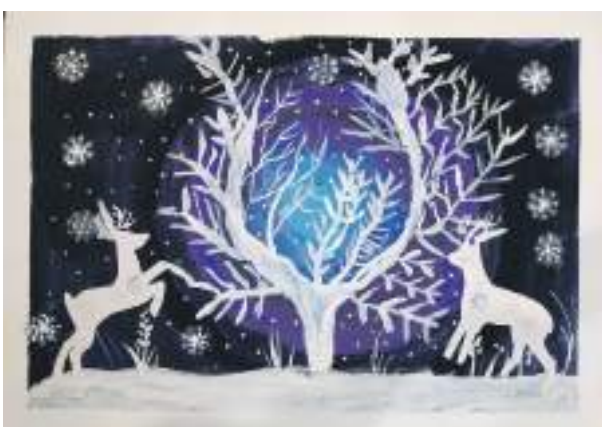
«Зимняя сказка». Рисунок Алексея Чудных (руководитель Дина Кислицца)