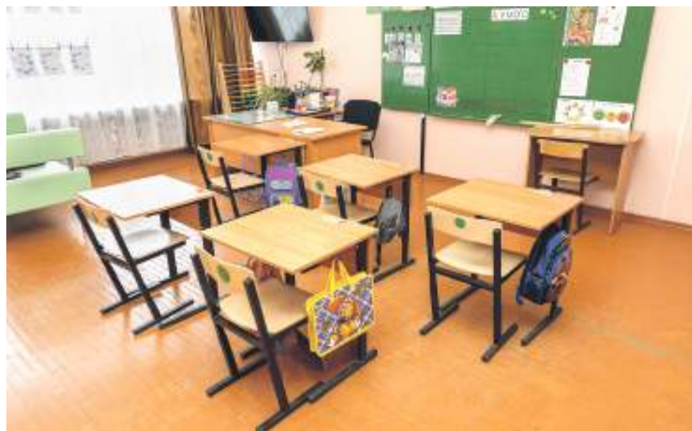
Класс для учеников с тяжёлыми интеллектуальными отклонениями

Слово «социализация» — слишком серьёзное, безликое, официальное. Но означает оно очень многое. Фактически — всю жизнь ребят в школе-интернате. Многие «особенные» дети совсем по-другому