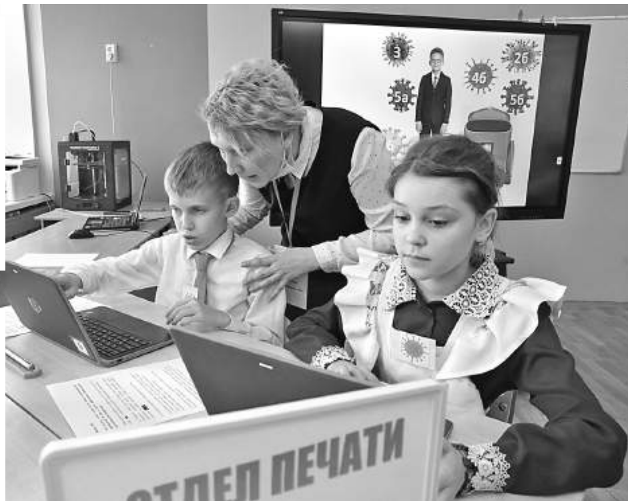
Отделу печати поставлена задача: найти информацию по профилактике коронавируса