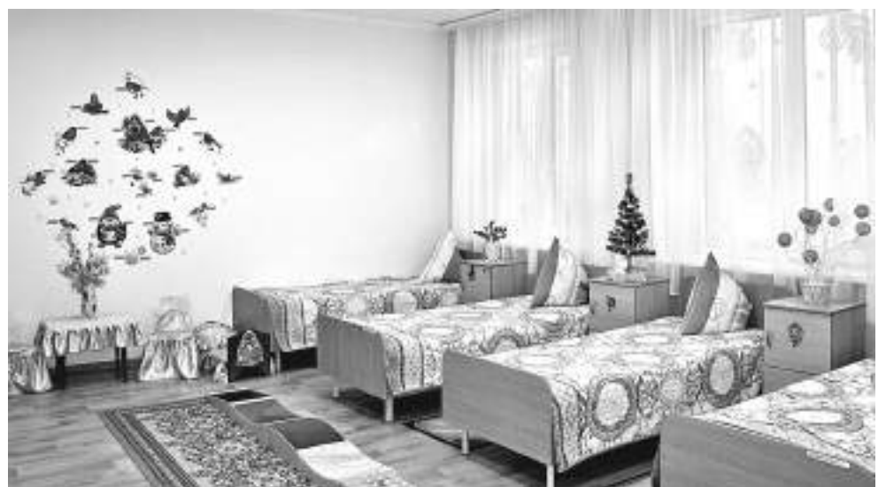
Спальная комната учеников начальных классов

классов ещё учатся в межшкольном учебном центре на водителей категории В.