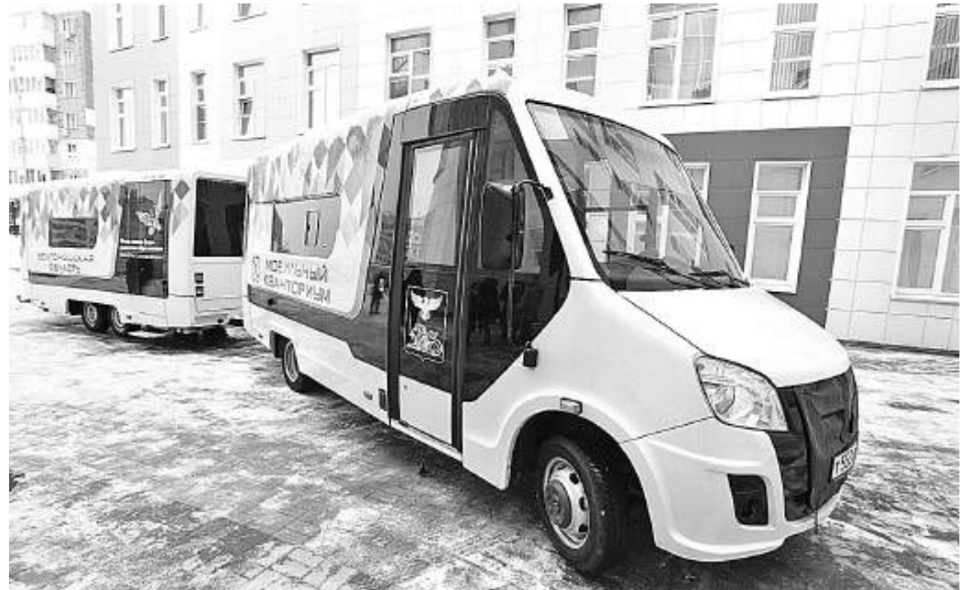
Мобильный технопарк «Кванториум»

КАК МОБИЛЬНЫЙ «КВАНТОРИУМ» ПОМОГ ОХВАТИТЬ ДОПОБРАЗОВАНИЕМ ТЕХНИЧЕСКОЙ НАПРАВЛЕННОСТИ УЧЕНИКОВ СЕЛЬСКИХ ШКОЛ