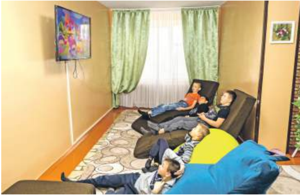
В свободное время можно посмотреть телевизор