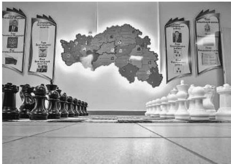
Оформление стен в Коцеевской школе Корочанского района