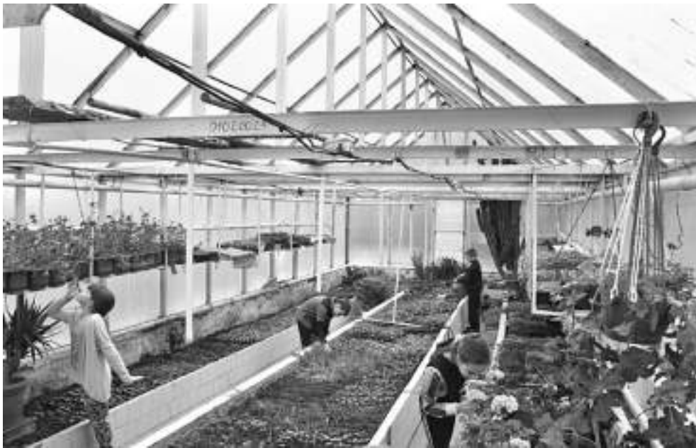
Школа имеет учебно-опытный участок площадью 0,75 га, где выращивают овощи и фрукты. В теплице зимой — зелень, весной — саженцы цветов

класса с современным оборудованием, шесть логопедических кабинетов, комната психологической поддержки, вокальная студия, спортивные и игровые площадки.