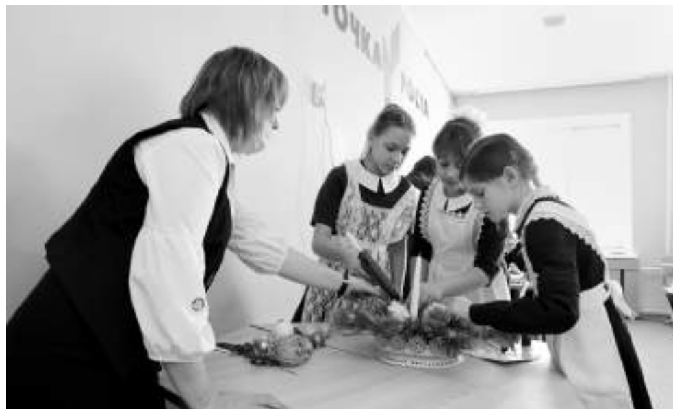
Девчонки из кружка «Станем волшебниками» за несколько минут создали новогоднюю композицию