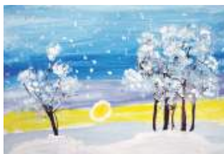
«Снег». Рисунок Юрия Кривокустова (руководитель Дина Кислицца)