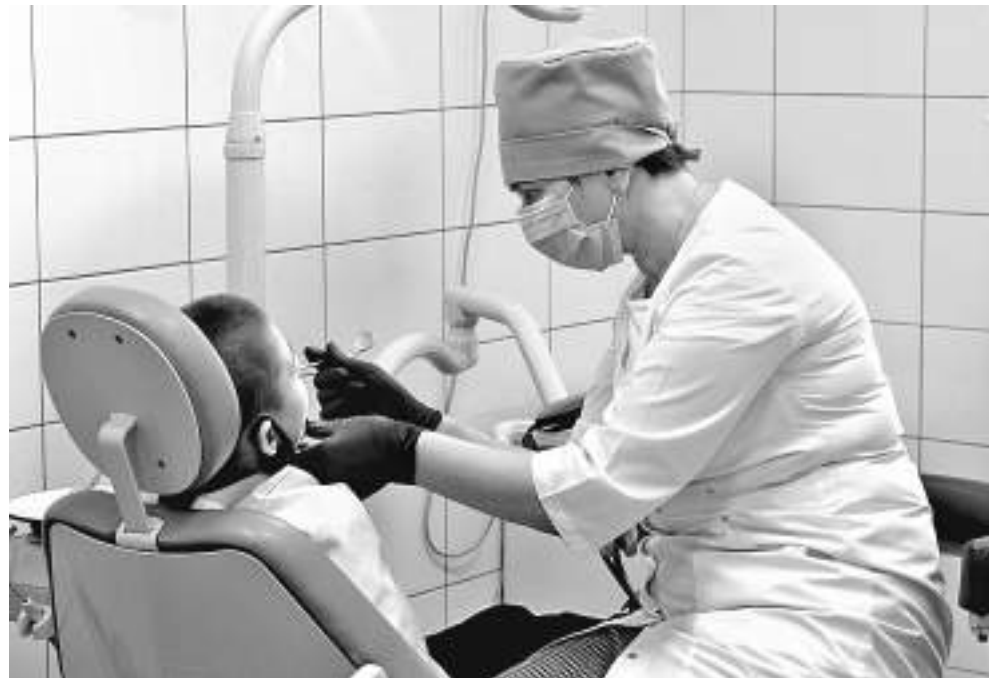
В лечебно-оздоровительном комплексе Корочанской школы-интерната оборудован стоматологический кабинет

Все дети в Корочанской школе-интернате с сохранным интеллектом, так что проблем с их социализацией нет. Но чтобы лучше подготовиться к взрослой жизни, участвуют в проекте «Уроки финансовой грамотности», а в рамках школьной программы на уроках технологии девочки учатся швейному делу (могут они и приготовить несложные блюда: салаты, оладьи, блины...), мальчишки в мастерских — столярному и слесарному. Ученики 10–11-х