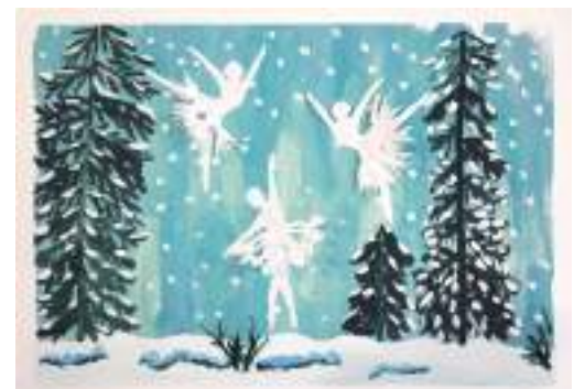
Коллективная работа объединения «Бумажные фантазии»