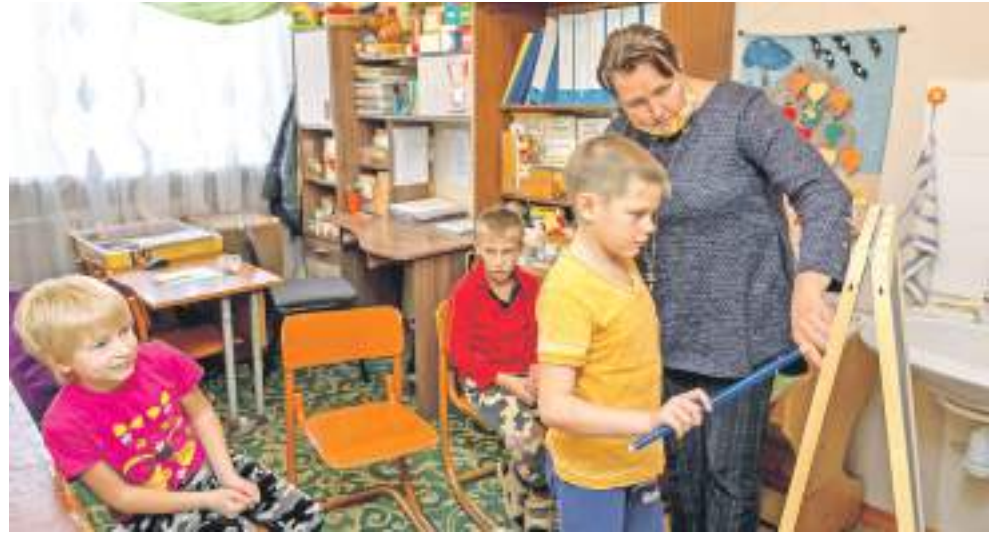
Творческие занятия на внеурочке