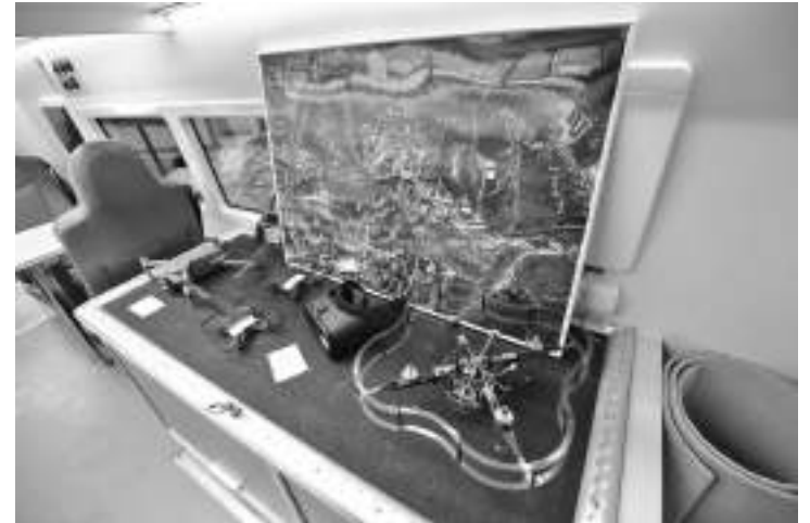
Мобильный «Кванториум» «начинён» современным оборудованием

Передвижная лаборатория с высокотехнологичным оборудованием с сентября колесит по шести муниципалитетам региона: Яковлевскому и Шебекинскому округам, Белгородскому, Борисовскому, Корочанскому и Прохоровскому районам.