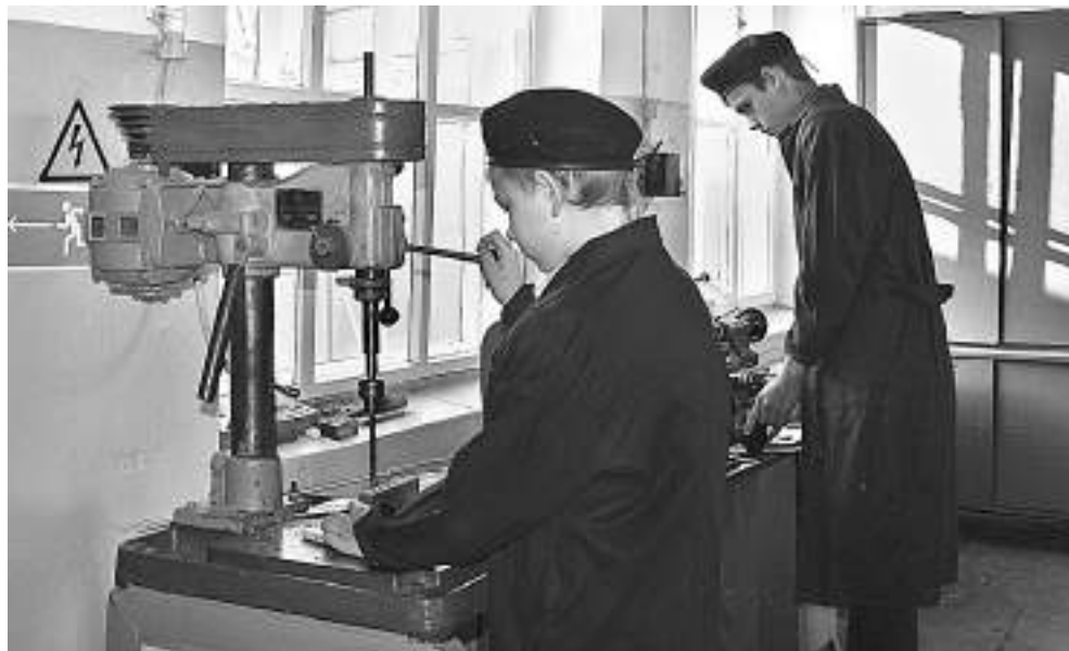
В школьной мастерской мальчишки учатся столярному и слесарному делу