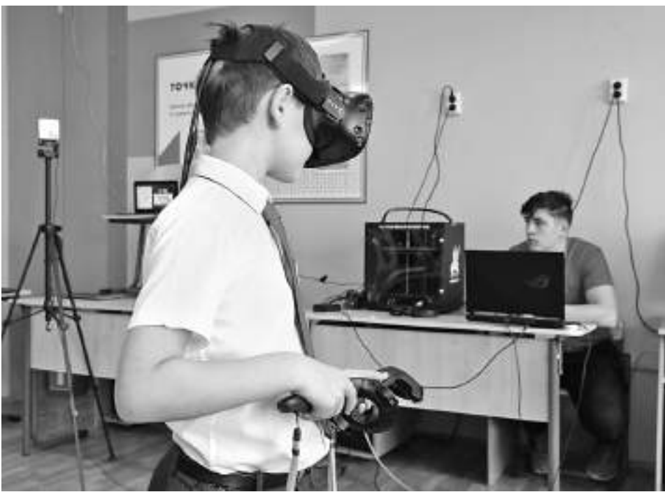
Путешествие вглубь лёгких с помощью очков виртуальной реальности

Старшеклассники Гостищевской школы раз в неделю на математике занимаются на платформе «Учи.ру». На внеурочке этот ресурс тоже активно используется. Нам показали одно из таких занятий: школьники выполняли на ноутбуках задания пробного тура олимпиады Vicsmatch.com+.