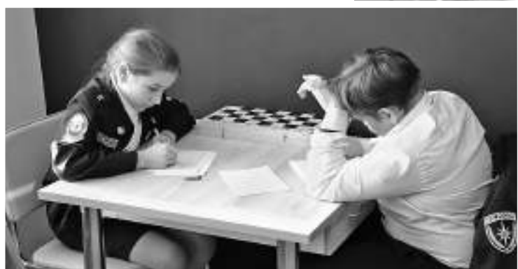
Рассчитать ценность шахматных фигур — задача нелёгкая