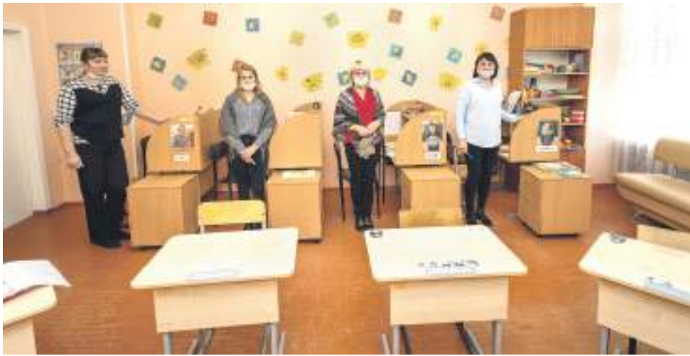
Тьюторы: каждый занимается с одним ребёнком с самыми тяжёлыми проблемами со здоровьем