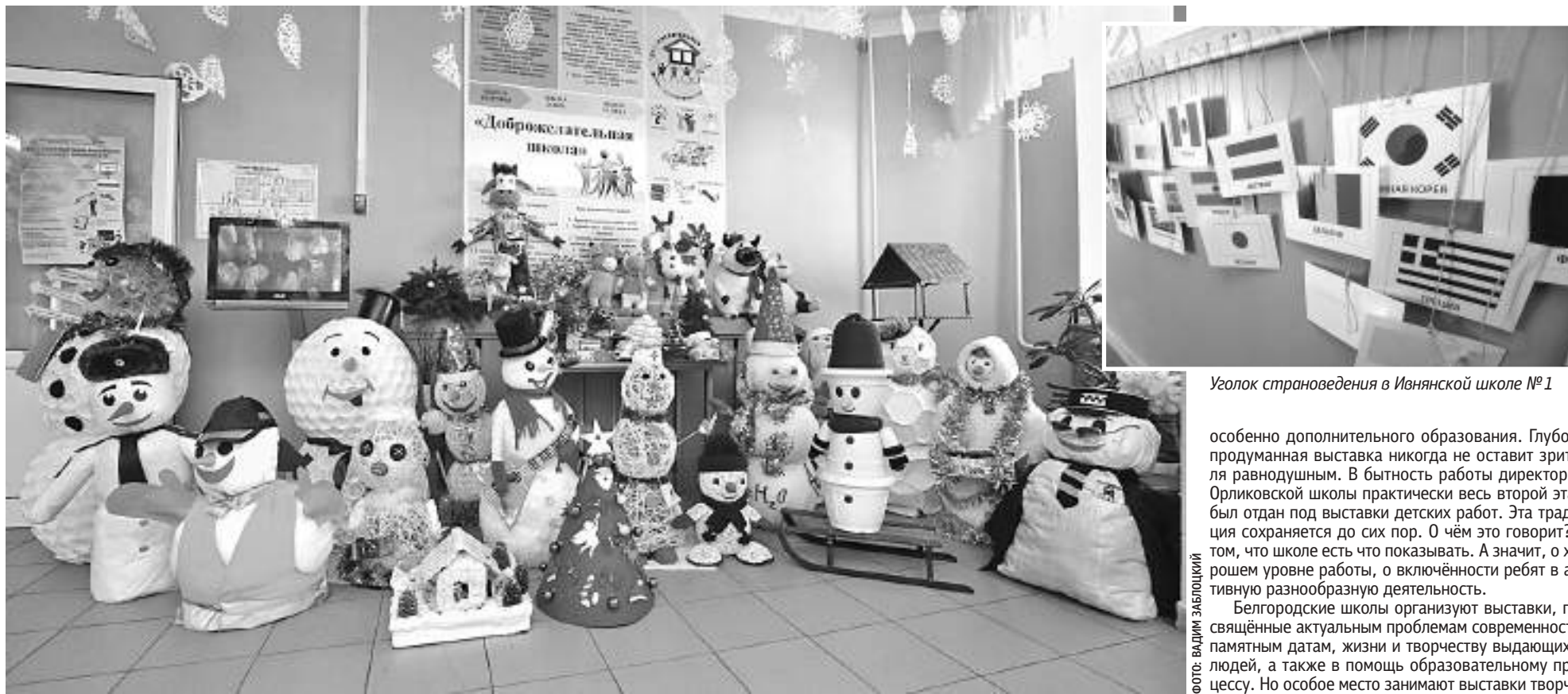
Оформление стен и рекреаций Гостищевской школы Яковлевского округа создаёт новогоднее настроение