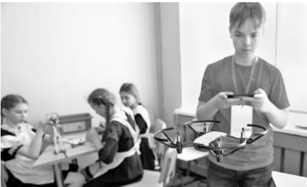
Запуск квадрокоптеров — любимое занятие мальчишек