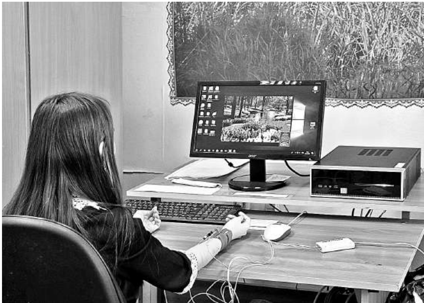
На занятии в кабинете БОС-здоровье

КАК КОРОЧАНСКАЯ ШКОЛА-ИНТЕРНАТ ДАЁТ ПУТЁВКУ В ЖИЗНЬ ДЕТЯМ С НАРУШЕНИЯМИ РЕЧИ