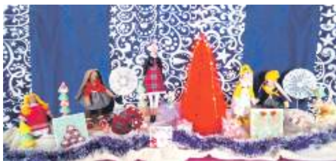
Подделки ребят из объединения «Умелые ручки»