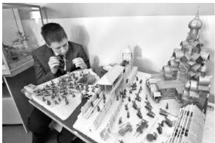
Вот такой макет старинной крепости ребята сделали своими руками