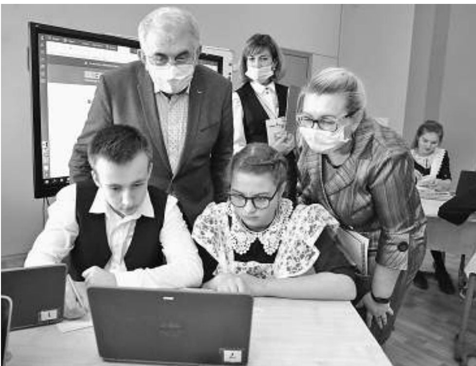
Решать олимпиадные задачи на платформе «Учи.ру» интересно и полезно!