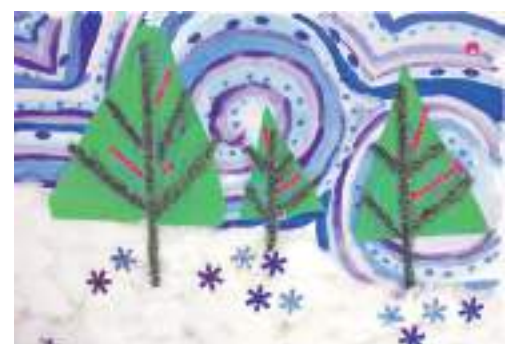
Коллективная работа объединения «Бумажные фантазии»