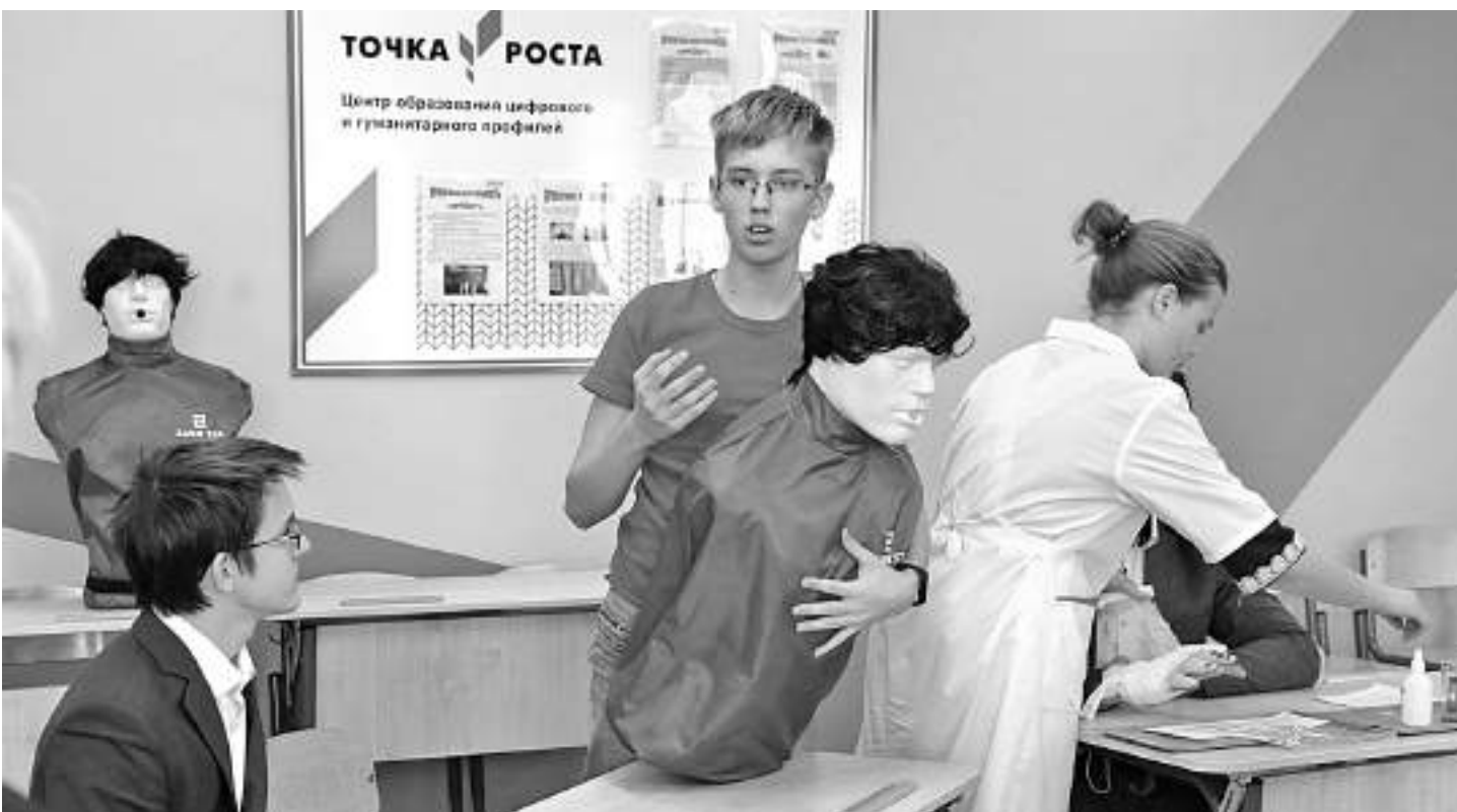
Оказывать первую помощь пострадавшим школьники учатся на манекенах-тренажёрах