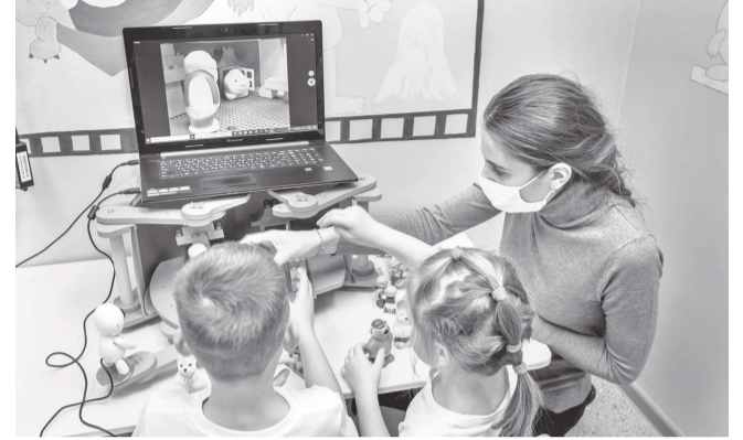
На занятии в детской мультстудии Kids Animation Desk