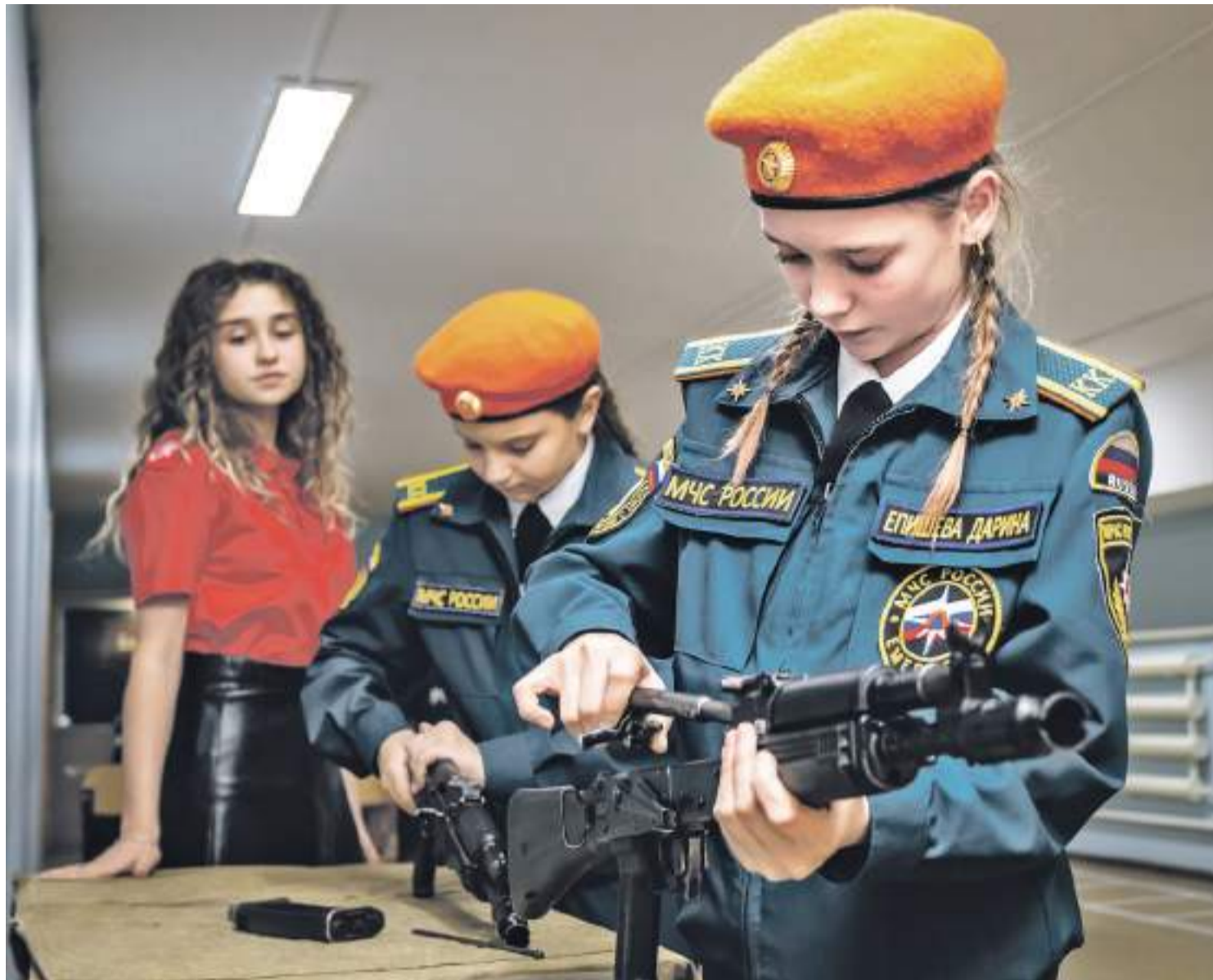
Любимое место мальчишек и девчонок — класс для военной подготовки и занятий в кружке «Военное дело». Здесь есть и тир. В кадетском классе учатся 28 ребят, они углублённо изучают ОБЖ, спасательное дело, военную подготовку. Учатся вязать узлы, читать карты, стрелять, занимаются строевой подготовкой