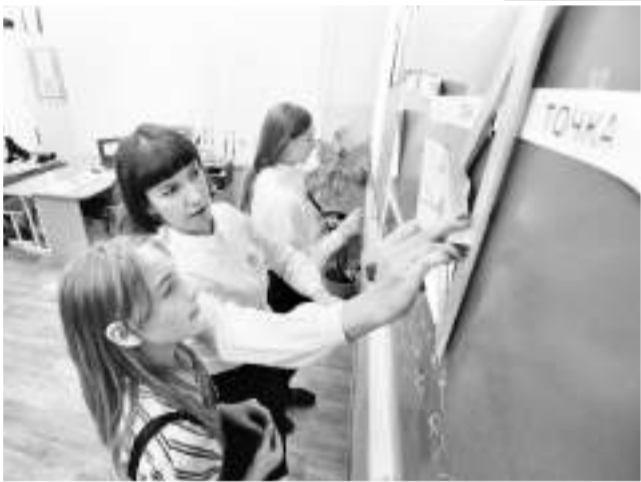
В поисках смежных углов