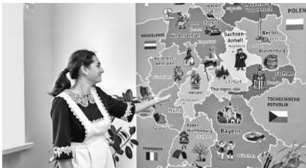
В Бехтеевской школе даже стены помогают учиться