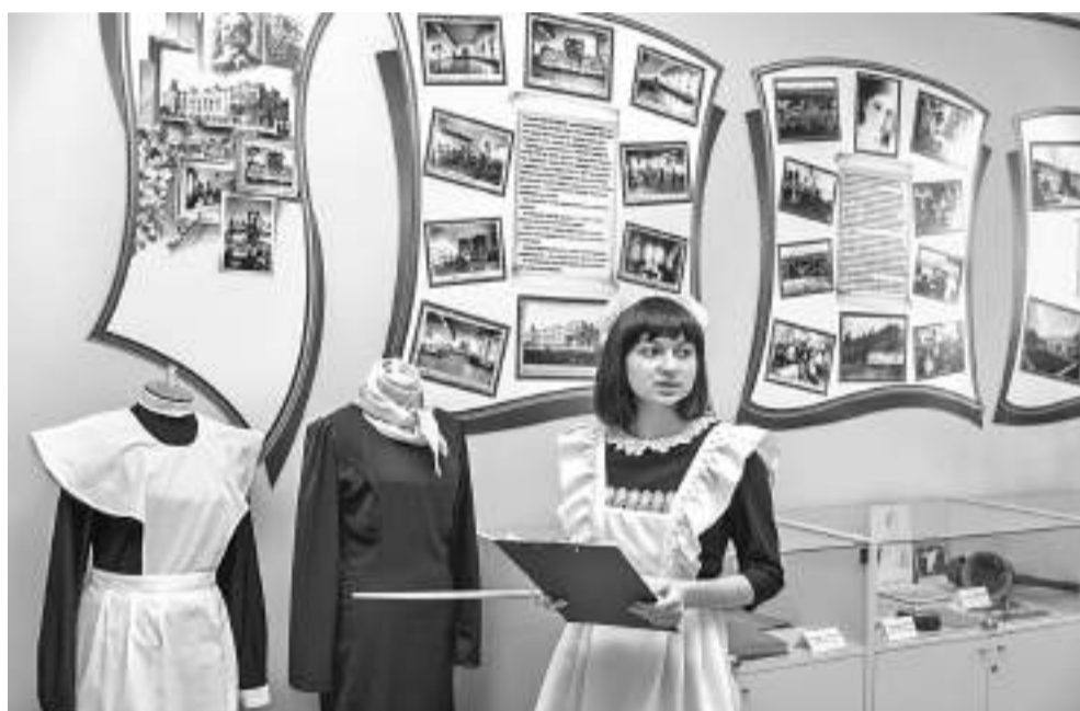
В музейном зале Корочанской школы имени Д. К. Кромского