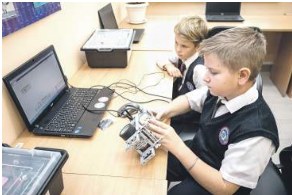
Ребята с удовольствием конструируют роботов из Лего