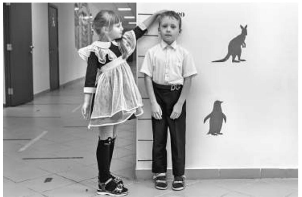
Бехтеевским ученикам нравится измерять свой рост на ростомере