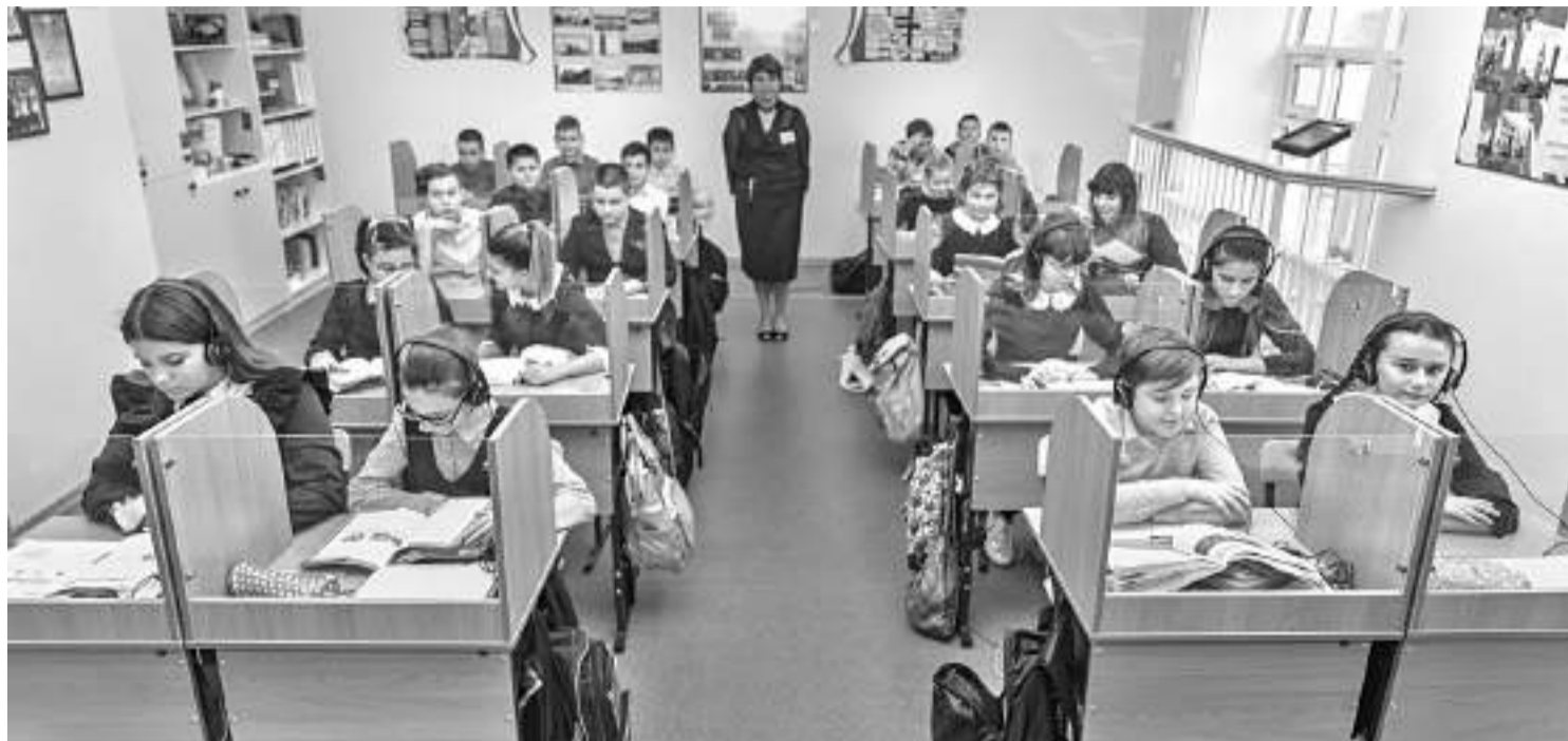
В лингафонном кабинете Корочанской школы им. Д. К. Кромского