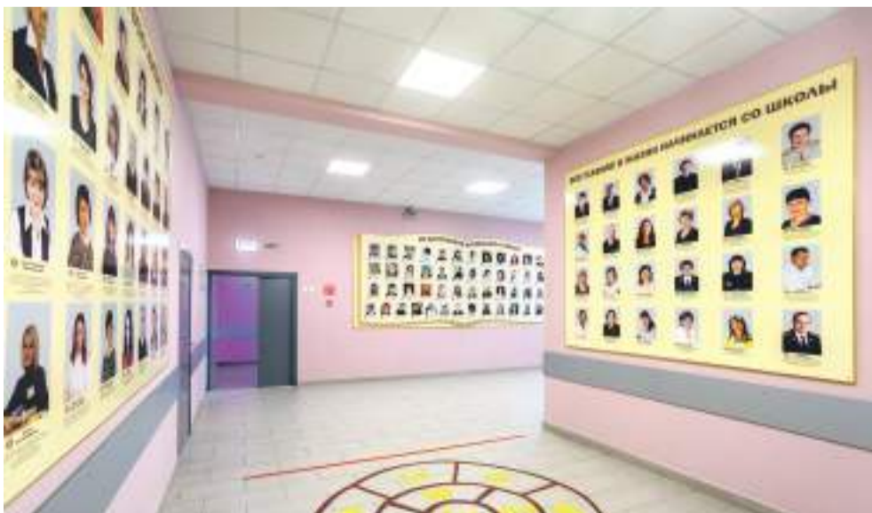
На стенах школы и классов — много полезной и интересной информации. Стенды, посвящённые учителям, выпускникам, отличникам, медалистам. Учебная и справочная информация. Здесь всё подчинено единому информационному и методическому пространству