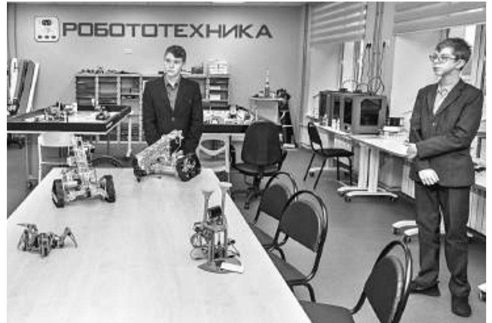
Лаборатория робототехники Корочанского районного детского технопарка