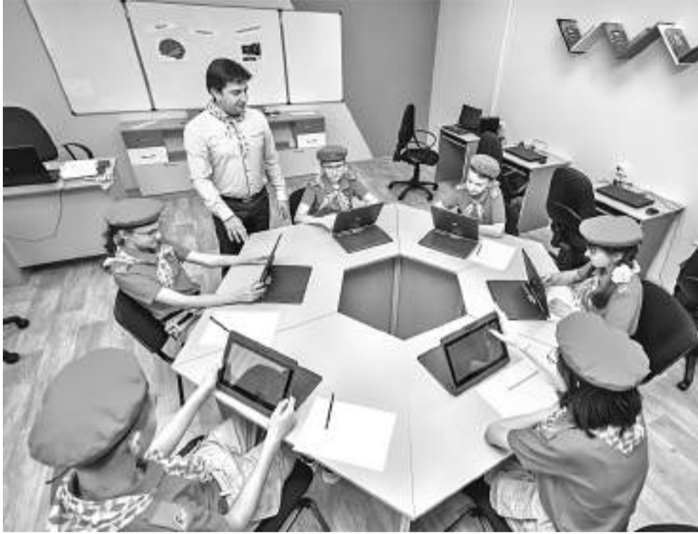
«Точка роста» в Коцеевской школе

Для самых подвижных «жителей» школы — учеников начальных классов — нарисовали лабиринты, классики, змейки и любимца всех мальчишек и девочек — ростомер (подойди, измерь свой рост и сравни его с ростом разных животных).