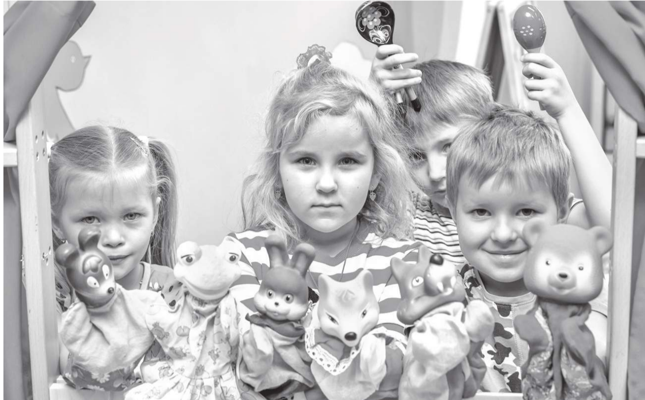
А вот и артисты, сыгравшие в «Теремке»

КАК КОРОЧАНСКАЯ «ЖЕМЧУЖИНКА» ПОМОГАЕТ ДОШКОЛЯТАМ РАСКРЫТЬ СВОИ ТАЛАНТЫ