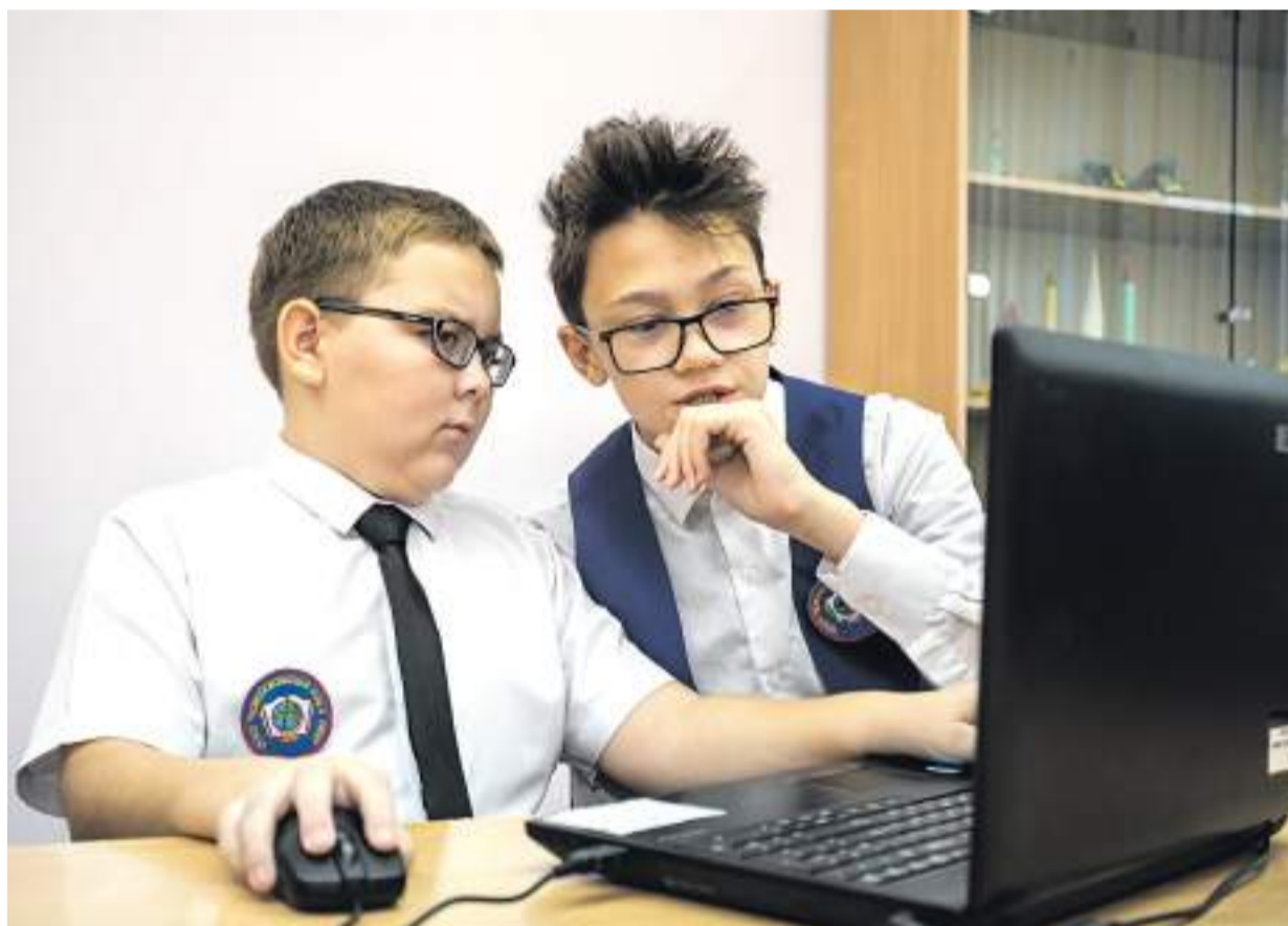
На внеурочке по 3D-моделированию

КАК В НОВООСКОЛЬСКОЙ ШКОЛЕ С УИОП СОЗДАЮТ КОМФОРТНЫЕ УСЛОВИЯ ДЛЯ ВСЕХ ДЕТЕЙ, НЕЗАВИСИМО ОТ ИХ СПОСОБНОСТЕЙ