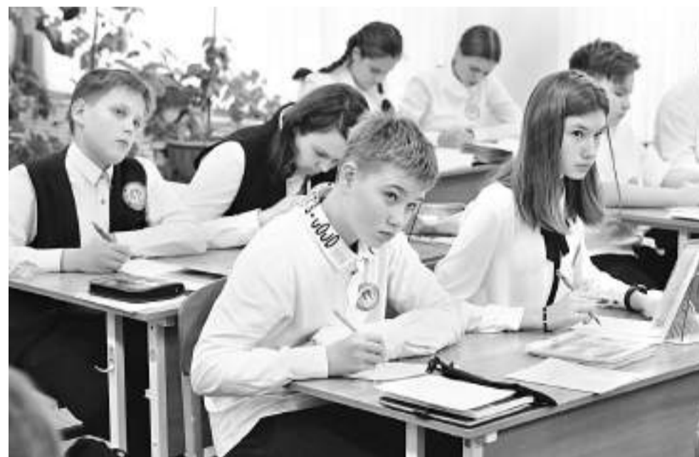
На уроке геометрии в 7 «Г» классе

— Предмет новый. Искали молодых педагогов, которые не боятся технологий. У нас, будущие учителя математики и физики, как раз в университете преподавали информатику, так что мы могли взяться за предмет. Да и склад ума у педагогов с физмата подходящий: алгоритмика, точность, всё по полочкам разложить... Чего было бояться? Персональные компьютеры простенькие, запомнить, где ка-