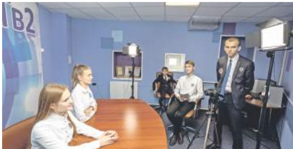
Редакция школьного телевидения и газеты «Компас»