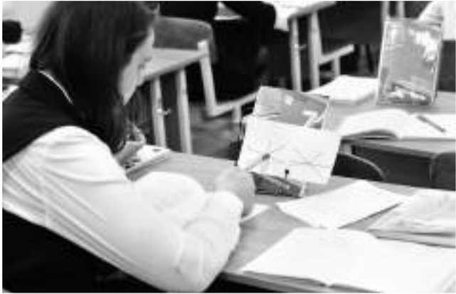
Работа с рисунком

КАК ИНСТРУМЕНТЫ ТАЙМ-МЕНЕДЖМЕНТА ПОЯВИЛИСЬ НА ОБЫЧНЫХ УРОКАХ МАТЕМАТИКИ И ГЕОМЕТРИИ