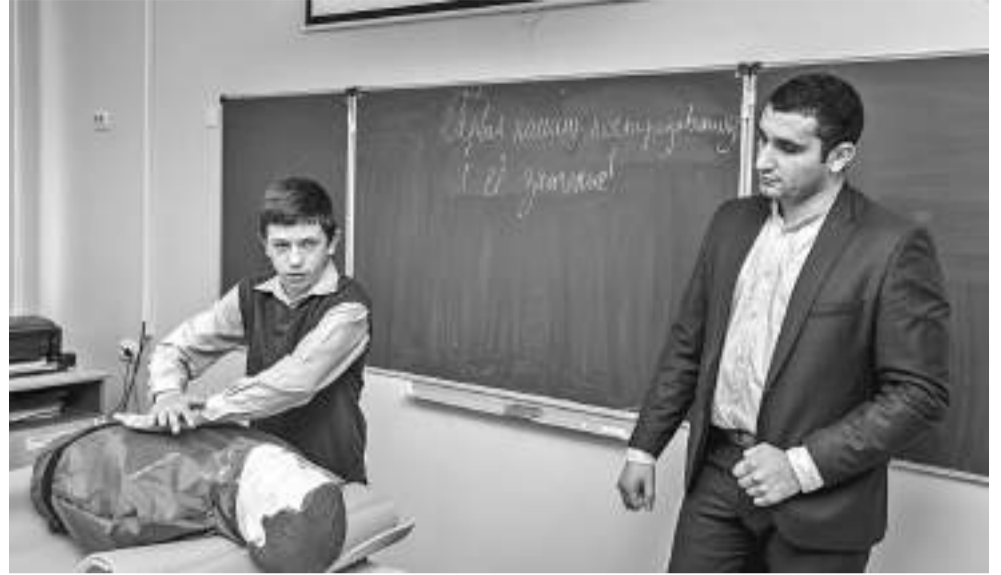
На уроке ОБЖ восьмиклассники Коцеевской школы учатся делать непрямой массаж сердца и искусственную вентиляцию лёгких

Ольга МУШТАЕВА » ТЕКСТ