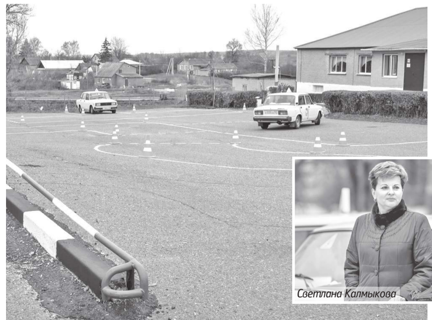
В автопарке Центра — 7 легковых автомобилей

Сегодня в межшкольном учебном центре занимаются 210 старшекласников. В штате — три преподавателя, семь мастеров. Нагрузка на каждого — 30 детей. Автопарк — семь легковых автомобилей. Занимаются раз в неделю по три часа. В период осенне-весенних простуд могут скорректировать обучение. Болели и пропустили занятие? Назначат дополнительное время. К примеру, на ближайших каникулах или в июне.