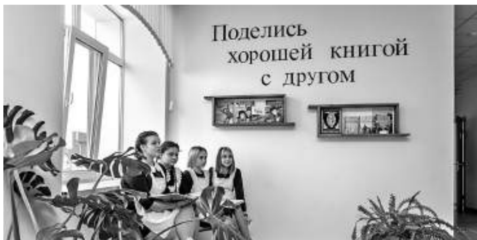
Зона буккроссинга в Бехтеевской школе

Корочанский район — край идейных педагогов. В прошлом году управление образования анонсировало выпуск районной газеты «#ДОБРЫЙКЛЮЧ» — педагоги восприняли на ура: «Нам есть что сказать!». В 2020-й, Год памяти и славы, инициировали проект «Живёт Победа в поколениях» — решили: «Хорошо! Мы уже столько материалов собрали. Есть чем поделиться». Провести последний звонок и выпускной-онлайн — жаль, конечно, но сможем! И так с каждой новой идеей, конкурсом, акцией или проектом, будь то зонирование школьной территории, переход (по возможности!) в режим школы полного дня или развитие наставничества среди детей, когда старшие берут шефство над младшими... Идейность не ради галочки передаётся и детям, в чём мы убедились, побывав в пяти корочанских школах: имени Д.К. Кромского, Алексеевской, Бехтеевской, Кошевской и Погореловской.