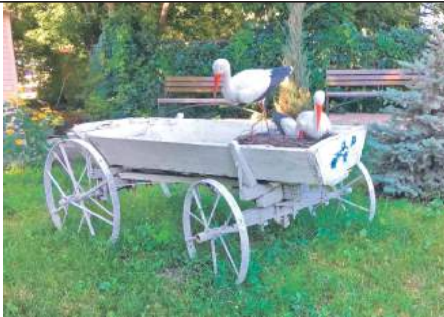
Центр образования № 1 г. Белгорода