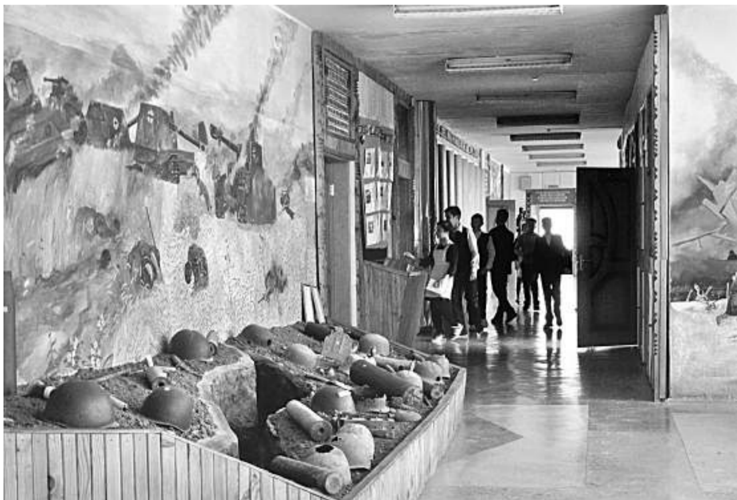
Школьный музей Великой Отечественной войны