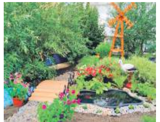
Рождественская школа Валуйского городского округа