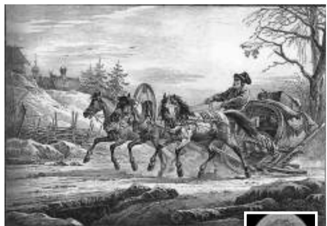
Настоящая кибитка — это крытая повозка, как на этой литографии Александра Орловского «Путешественник в кибитке, или Сани, запряжённые тройкой» (1819, Киевская картинная галерея)

Другие ученики назвали кибитку «птичкой», летящей с Кубы и крыльями поднимающей снег»; «поездом, который очень быстро едет, и поэтому снег летит вверх и вниз» и даже «кибернетической, шустрой тёткой». Ямщик, по их мнению, оказался «дядей, профессия которого — таскать ящики»; человеком, роющим ямы, вероятно, карликом, «потому что сидит на чём-то маленьком и прячется в ямку».