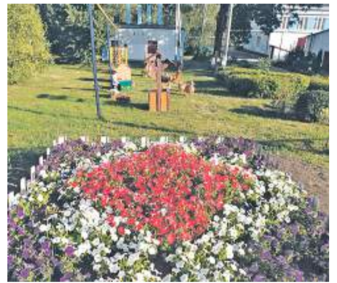
Старобезгинская школа Новооскольского городского округа