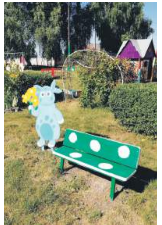
Детсад № 4 с. Алексеевка Корочанского района