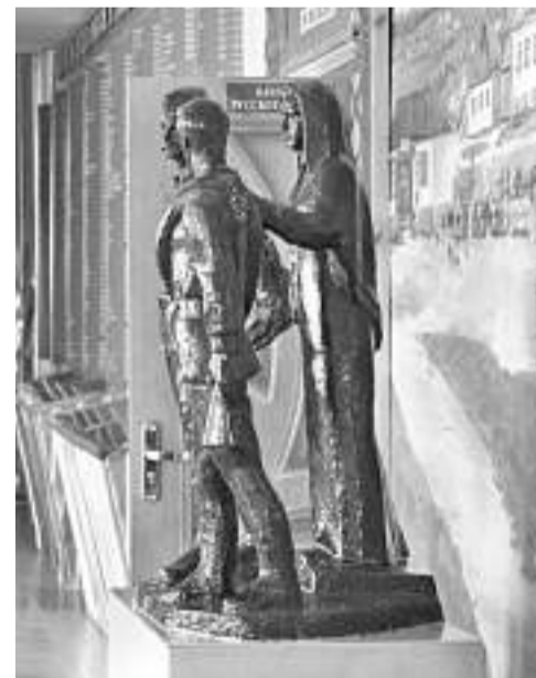
Школьный музей Великой Отечественной войны

Уверена в том, что в школе всегда ведущей и главной должна быть функция воспитания, ответственности за формирование человеческой личности. В детях необходимо формировать нравственные принципы, делая это незаметно и каждодневно. В нашей школе детей и педагогов связывают