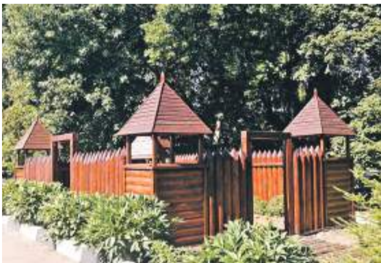
Школа № 4 г. Валуйки

Школа начинается со школьного двора. От того, как он обустроен, зависит многое. Настроение ребят и учителей. Их желание идти в школу. Адаптация первоклассников к учебной жизни. Недавно на Белгородчине уже много лет проводят конкурсы на лучшее обустройство школьных территорий. Если к делу подойти с душой, то школьный двор можно превратить и в ботанический, и в сказочный сад, и в обучающее пространство. В группе «Доброжелательная школа Белогорья» в соцсети «ВКонтакте» мы попросили учителей и учеников поделиться с редакцией фотографиями дворов их школ. И детских садов. Давайте вместе полюбуемся на нашу школьную красоту! Ну и в нашем редакционном портфеле кое-что нашлось.