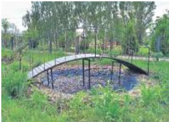
Уразовская школа № 2 Валуйского городского округа