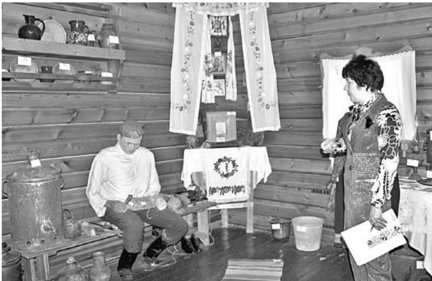
В школьном музее этнографии

НО ДАЖЕ САМОЕ КРАСИВОЕ, ПУСТЬ И ДОБРОЖЕЛАТЕЛЬНОЕ ОФОРМЛЕНИЕ МОЖЕТ СТАТЬ БЕСПОЛЕЗНЫМ, БЕЗДЕЙСТВЕННЫМ,