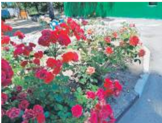
Детсад № 48 «Вишенка» г. Белгорода