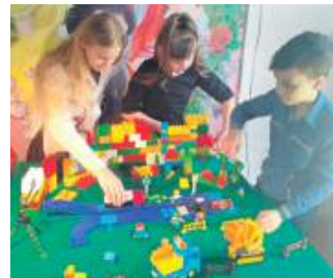
Студия мультипликации в Доме детского творчества