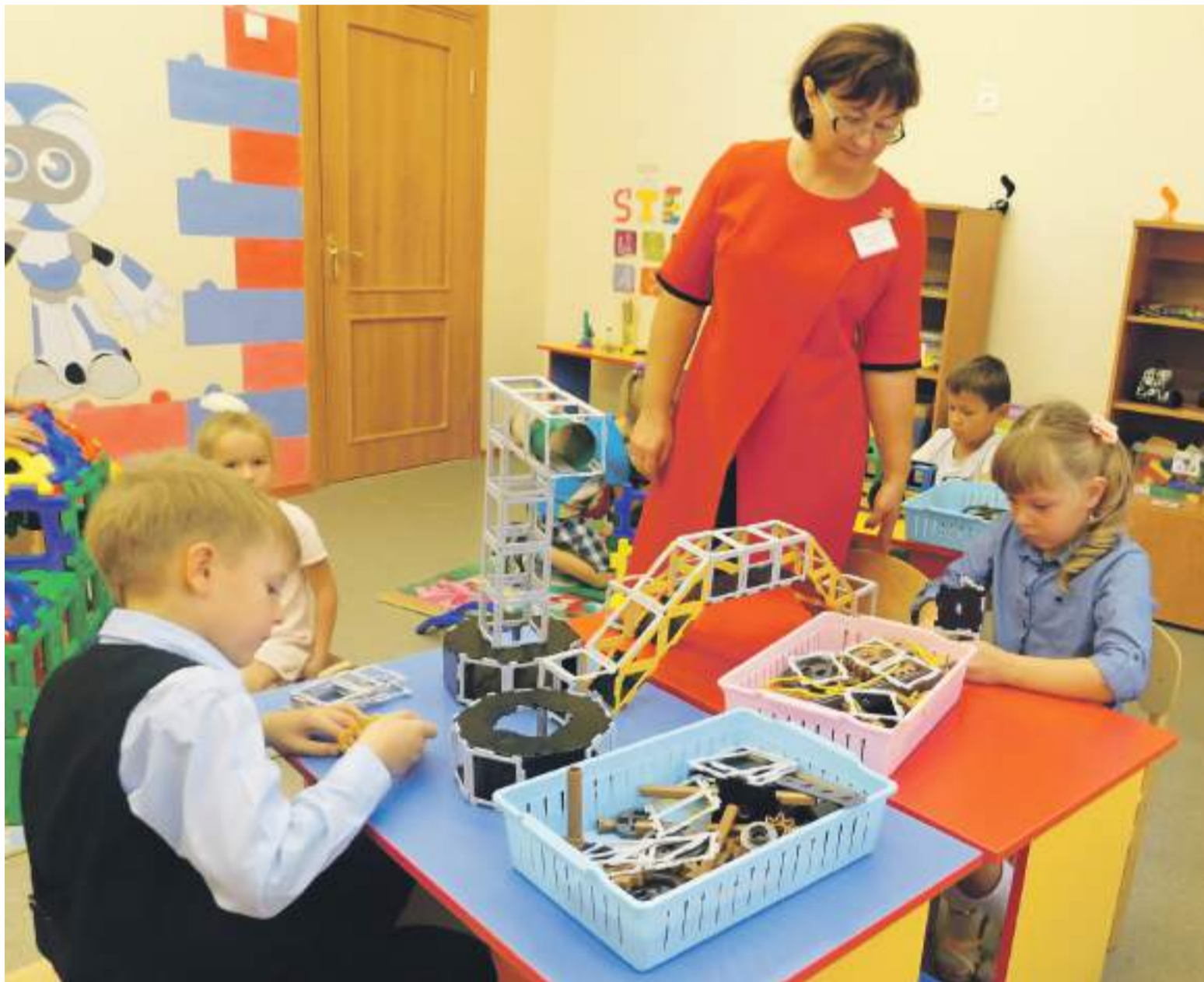
Инженерное образование малышей начинается с конструирования

Школьный технопарк позволяет создать эффективную систему профориентации, популяризировать среди школьников и их родителей востребованные инженерные и технические специальности. И, конечно, помогает выявить «техно-звёздочек» среди учеников в сетевом взаимодействии образовательных учреждений города.