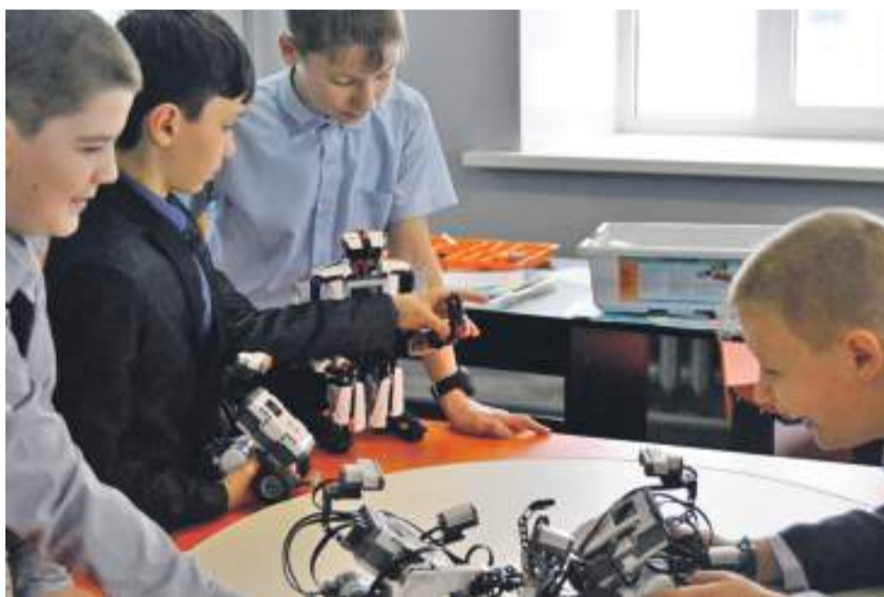
Технопарк в школе № 1

Ещё один важнейший элемент современной инфраструктуры — создание цифровой образовательной среды. Для решения проблемы взаимоотношений «цифровые ученики и нецифровые» учителя создали школьный медиацентр «МедиаДикт».