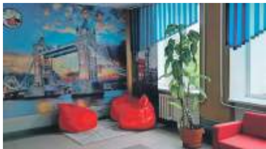
Рекреационная зона в школе № 1