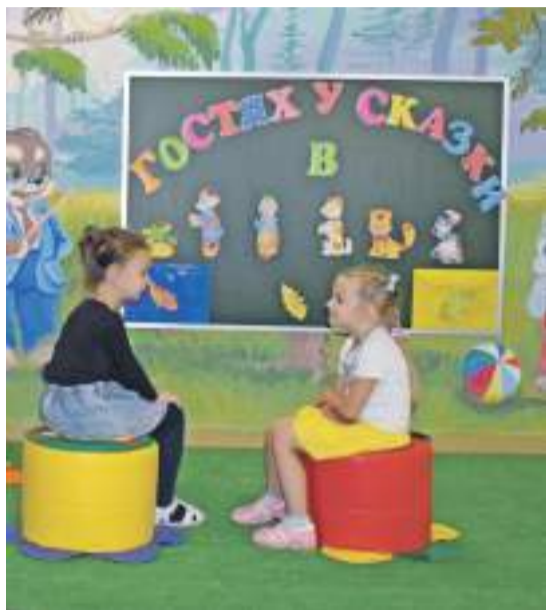
В детском саду № 4