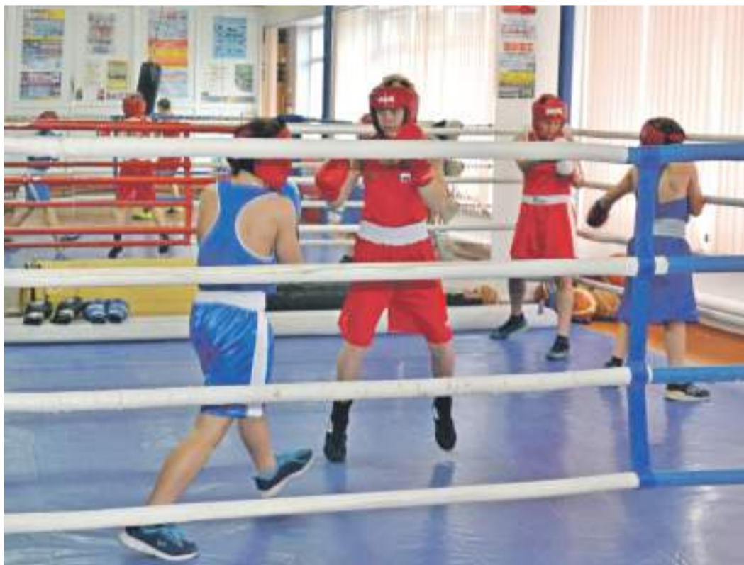
Тренировки по боксу в школе № 4