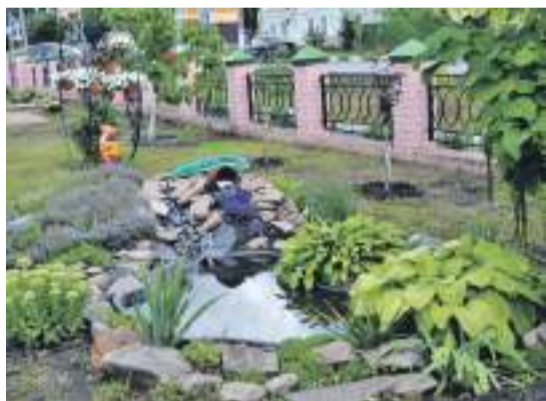
Ландшафтный дизайн на территории школы № 2