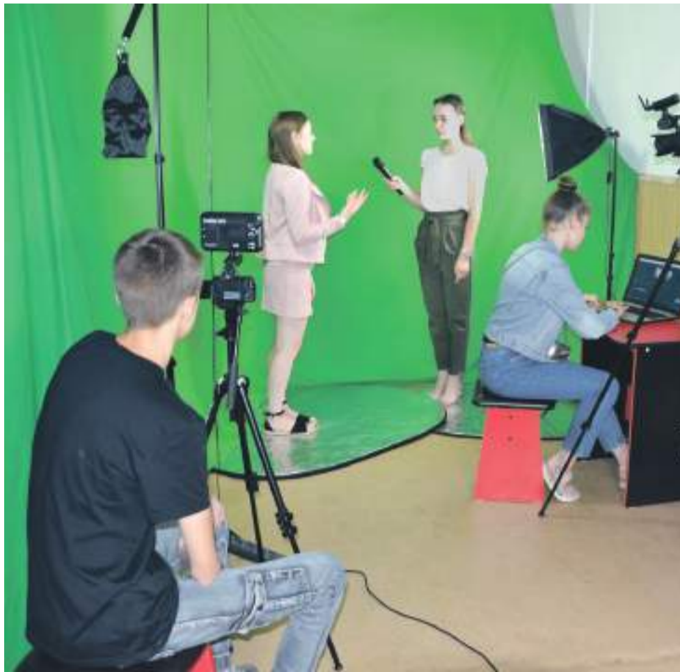
В школьном медиацентре «МедиаДикт» школы № 1