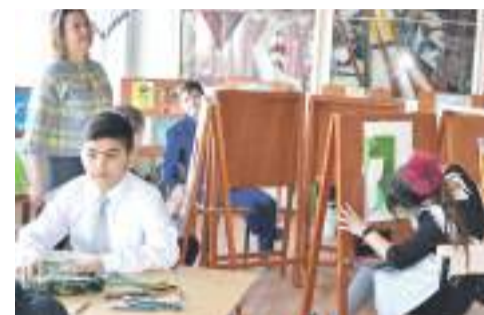
В изостудии школы № 4